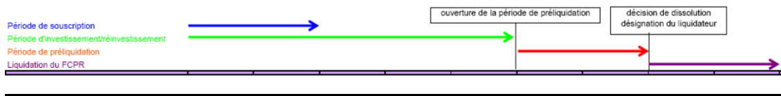
Schéma de l'enchaînement des différentes étapes de la liquidation d'un fonds