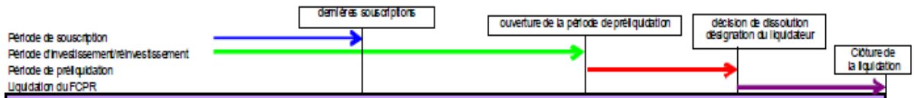
Schéma récapitulatif de l'enchaînement des trois étapes de la liquidation d'un FCPR

La liquidation d'un FCPR comprend trois étapes :